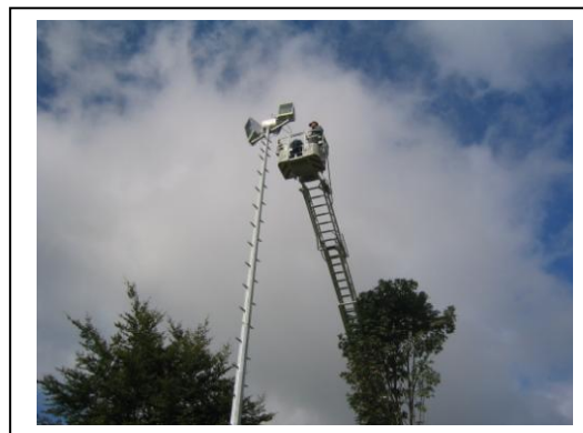
Wer steht wohl im Korb?